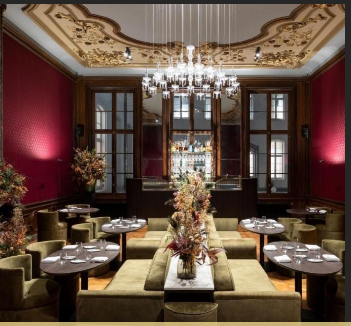
Hotel in the heart of Antwerp reopened in 2019 (hotel since 16<sup>th</sup> century): Sapphire House Antwerp – Lange Nieuwstraat 20-24, 2000 Antwerpen